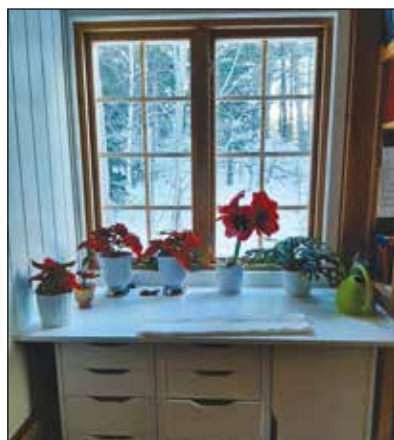
Blomsterbenk på pauserommet.