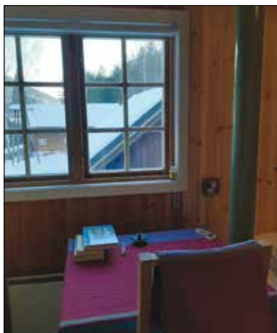
Utsikt fra Moserommet.

Vi håper å kunne komme med flere bilder i Rundbrevene framover. Takk for at du vil være med og gjøre Bakkehuset til et mer komfortabelt sted for husfolkene våre! Og til et mer praktisk sted for oss alle.