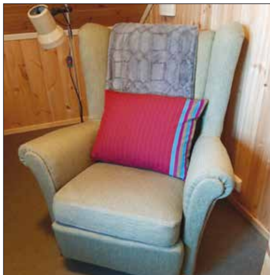
Godstol på Moserommet.