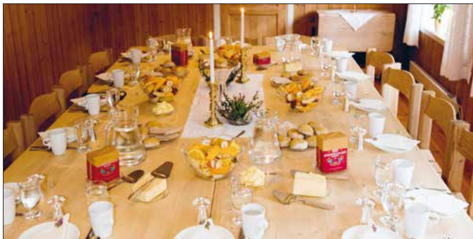
Du dekker bord for meg.

Av og til får vi overraskelser – små og store hverdagsvelsignelser. Jesus er tilstede i hverdagen. Kan det være en invitasjon til å stoppe opp og skifte fokus? Oppdage velsignelsen?