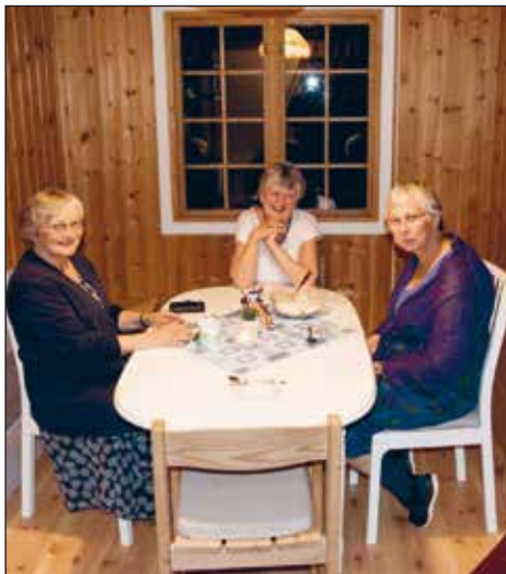
Glade husfolk på pauserommet.

I annen etasje, der det gamle tørrlageret var, har vi fått ferdig husfolkrommet «Mose», det mosegrønne rommet! Her er kanskje Sandoms beste utsikt over tunet og elva. Det står en del detaljer igjen, men rommet har vært i bruk i sommer. Takk til alle som har vært med og bidratt med gaver og bønn!