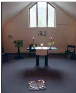
Himmelfart og velsignelse